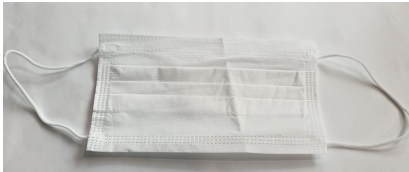
Foto: mascherina in esame sottoposta al test di mineralizzazione ed analisi dei metalli sul talquale